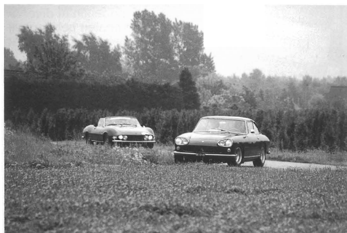
De Veluwerit 26