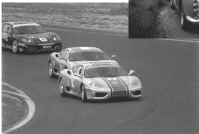
13 e Italia a Zandvoort

Op de voorzijde De Mille Miglia blijft het allereerste historische autosportevenement, wat overduidelijk wordt benadrukt door deze fantastische sfeerplaat van Edwin van Nes. Situated middelpunt op deze foto is de Ferrari 225 S (# 0152 EL) voorzien van een Vignale carrosserie.