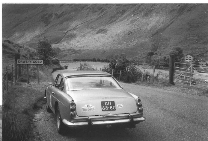
Three Castles Welsh Classic Trial 20

Op de voorzijde De Mille Miglia blijft het allereerste historische autosportevenement, wat overduidelijk wordt benadrukt door deze fantastische sfeerplaat van Edwin van Nes. Situated middelpunt op deze foto is de Ferrari 225 S (# 0152 EL) voorzien van een Vignale carrosserie.