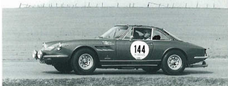
De fraaie 330 GTC trok veel aandacht

"Wij ontdekten verscheidene "Ferraristi" onder de deelnemers, soms in vreemde automobielen, zoals een Healey of een Triumph".